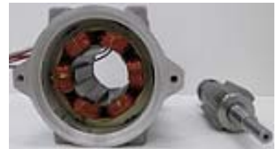
スイッチトリラクタンス機

個々の研究テーマは独立していますが, シミュレーションモデルや実験装置は同じものを使用しますので, 学生同士で協力しやすいと思います。